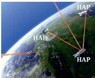
FSO-Links (Freistrahloptische Datenlinks) zur Vernetzung von HAPs und Satelliten

Um eine nahtlose Abdeckung zu erreichen, ist eine große Anzahl an Satelliten erforderlich. Erste Systeme, wie die OneWeb-Satellitenkonstellation, sollen beispielsweise auf 648 Satelliten basieren. Dies bringt auch für die Steuerung der Satelliten, den Betrieb des Systems und für die Vermeidung von Weltraumschrott eine Reihe von Herausforderungen mit sich. Zudem müssen die einzelnen Satelliten sehr klein und kostengünstig sein, um einen wirtschaftlichen Aufbau und Betrieb des Systems zu ermöglichen.