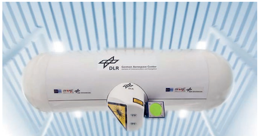
Experimentelles optisches Kommunikationsterminal für die Stratosphäre, geflogen im Projekt CAPANINA 2005

Bereits 2003-2006 wurde im EU-FP6-Projekt „CAPANINA“ [CAP] diese Technologie für Kommunikationsnetze erforscht. Ohne bewilligtes Folgeprojekt allerdings wurden diese Entwicklungen in Europa nach 2006 nicht mehr in ausreichendem Umfang weiterverfolgt.