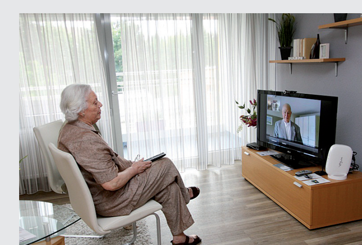
Fernsehapparat mit Kommunikationsbox